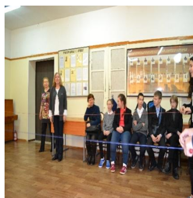
квест «Секрет профессионального успеха»

15 марта 2017 года в Некрасовском педагогическом колледже прошел День открытых дверей. Познакомиться с колледжем пришли более 300!!! абитуриентов вместе со своими родителями. Впервые до начала «официального» разговора о приемной кампании участникам мероприятия было предложено посетить интерактивные площадки, на которых студенты и преподаватели знакомили гостей со специальностями, по которым осуществляется обучение в колледже. Абитуриенты и их родители с неподдельным интересом играли, танцевали, знакомились с конструктором Перворобот Lego, осваивали