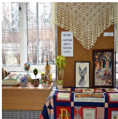
Выставка творческих работ педагогов «Талантливые педагоги талантливы во всём!»

Новой формой работы стала организация выставки творческих работ педагогов колледжа «Талантливые педагоги талантливы во всём!». Выставка получилась яркой, интересной и вызвала неподдельный интерес как у обучающихся колледжа, так и у абитуриентов и их родителей.