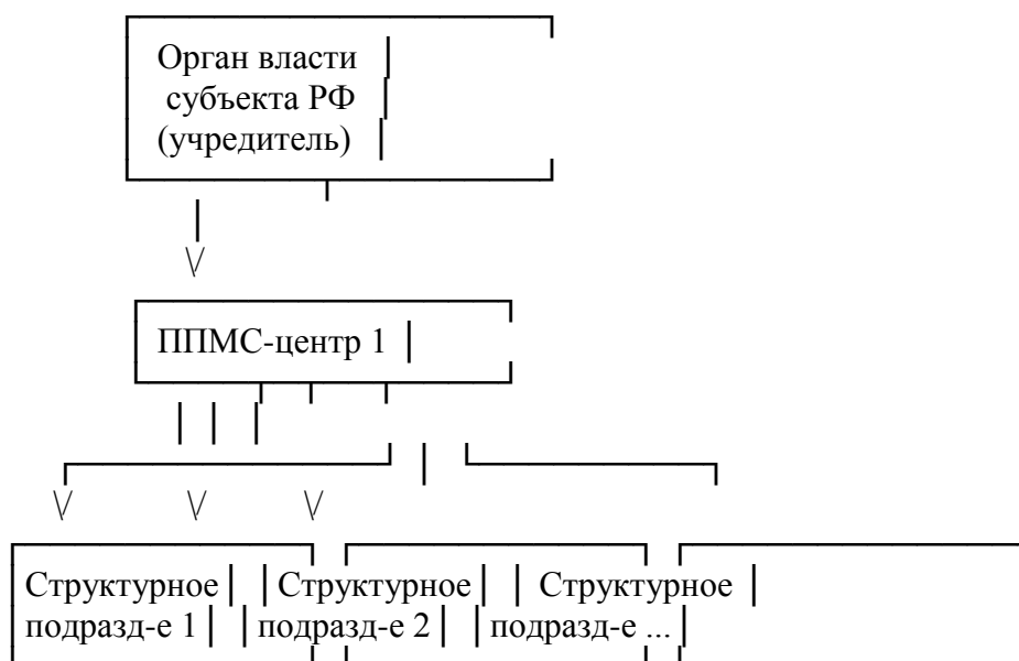
Рис. 2. Схема централизованной модели организации деятельности ППМС-центров

В регионе уполномоченным органом власти создается Центр с филиалами, которые распределяются в соответствии со спецификой территориального расположения, численностью детского населения и его потребностью в помощи. Центр представляет собой жесткую иерархическую систему оказания психолого-педагогической, медицинской и социальной помощи. Такая структура позволяет обеспечить высокую централизацию управления, единый стандарт услуг, рациональное использование кадровых и финансовых ресурсов, прозрачность и достоверность результатов деятельности.