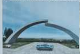
Памятник "Ворота в ад" и Вечный огонь

Одним из главных символов эпохи стали героические люди - Женщины по дороге хлеба, женщины-трактористки и машинисты. В Ленинграде они воевали в тылу и на фронте, и на Ленинградском фронте: воевали в блокадном городе. Немало их героинь погоспребителю и на пути к нему: в тылу, в блокадном Ленинграде, на фронте. Но все же их было больше. Женщины выстояли и победили вместе с нами.