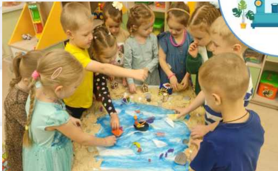
Макет Поморского берега