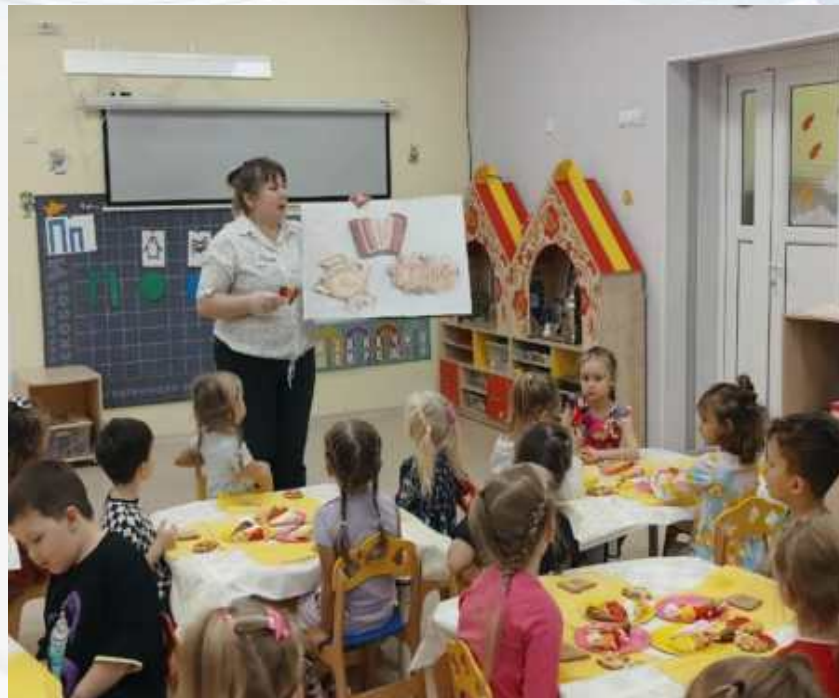
Мастер-класс по украшению пряников