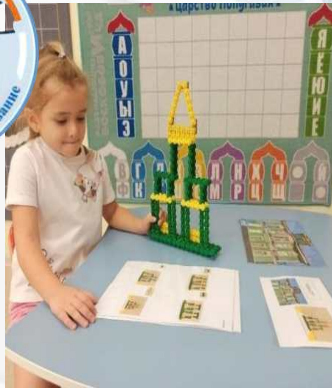
Дом А.С. Чудинова