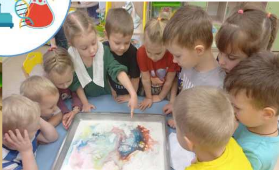
Экспериментирование северное сияние