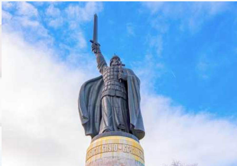
Памятник Илье Муромцу

Тема путешествия: «На родину Ильи Муромца и муромского калача»