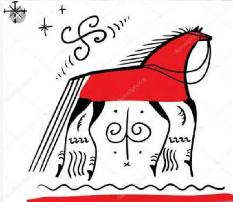
«Образ коня» в мезенской росписи