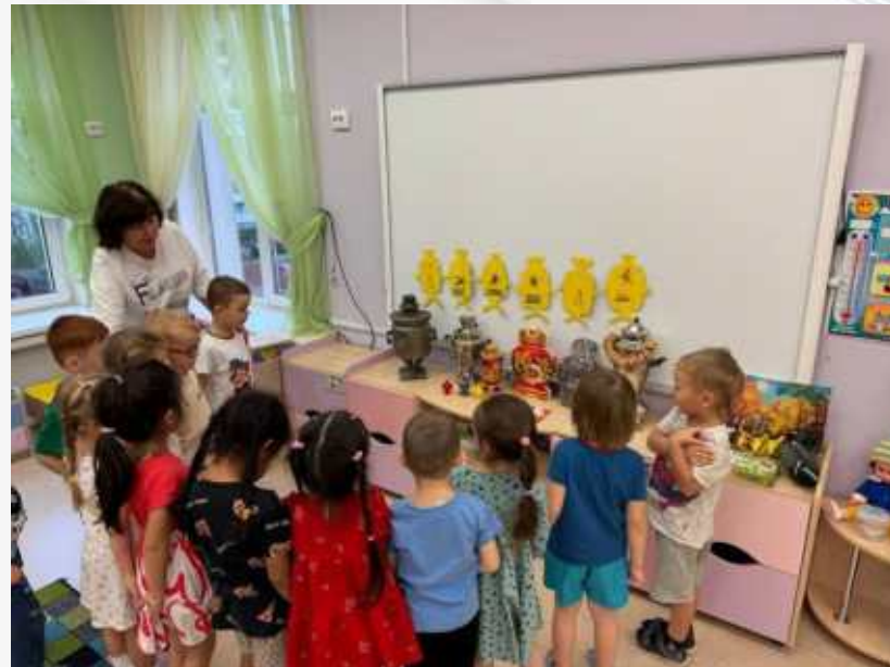
Выставка «Самовары бывают разные»