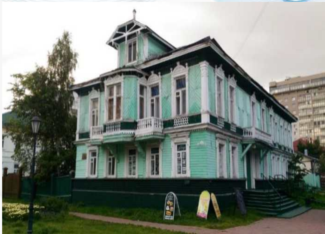
Памятник архитектуры «Дом А.С. Чудинова»