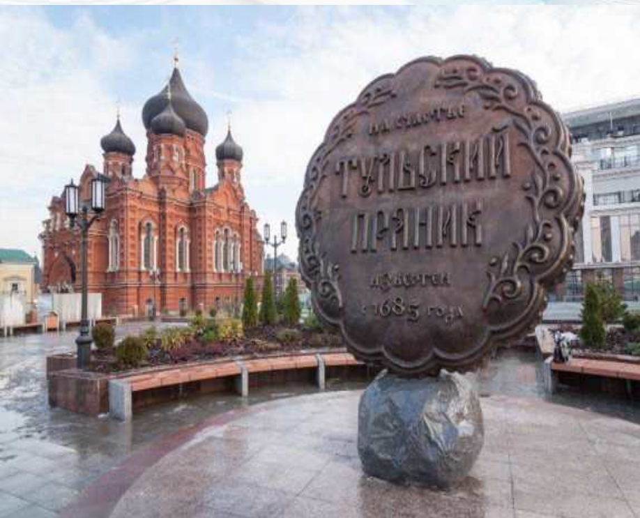
Памятник Тульскому прянику