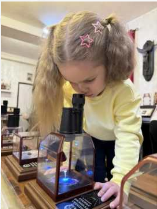
Музей «Русский Левша»