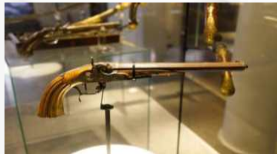
Ружье Екатерины II