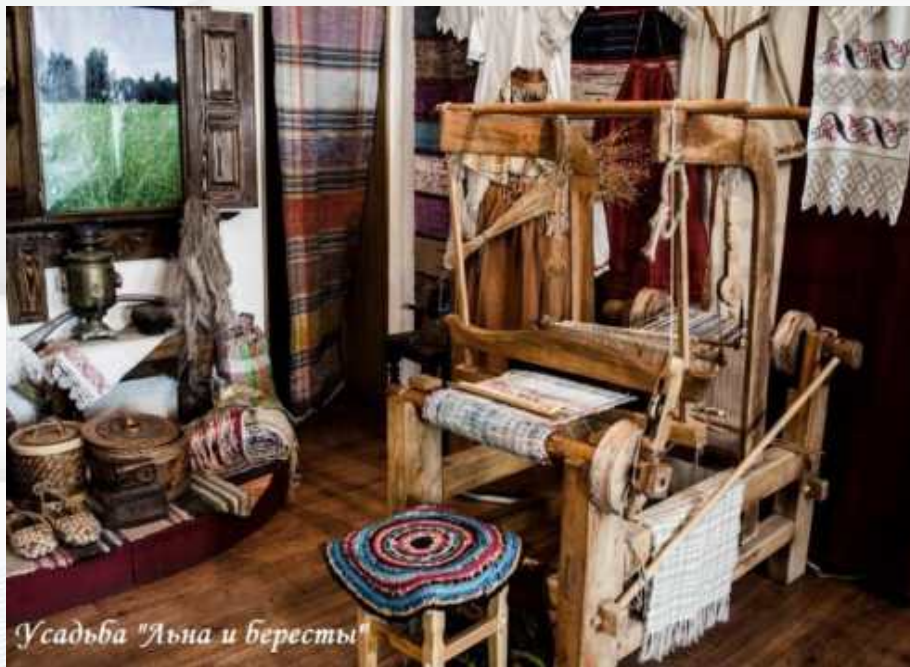
Усадьба "Льна и бересты"